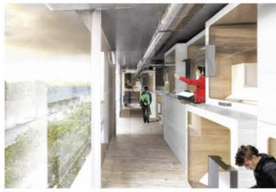
Couchage de style japonais au NOC46.