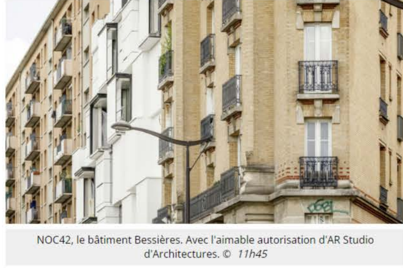
NOC42, le bâtiment Bessières. Avec l'aimable autorisation d'AR Studio d'Architectures. © 11h45

L'un des principaux objectifs du projet, que l'on peut déjà deviner grâce aux cubes déconstruits qui composent les bâtiments, est d'être reconfigurable à l'infini pour différents besoins. Le campus, qui ne ressemble à aucun autre, est ouvert 24h/24 et 7j/7 et n'est pas utilisé de la même manière et en même temps par tout le monde, et ne connaît donc aucun pic de consommation de jour comme de nuit. C'est un lieu d'innovation qui éveille la créativité, que l'on soit un lève-tôt ou un oiseau de nuit.