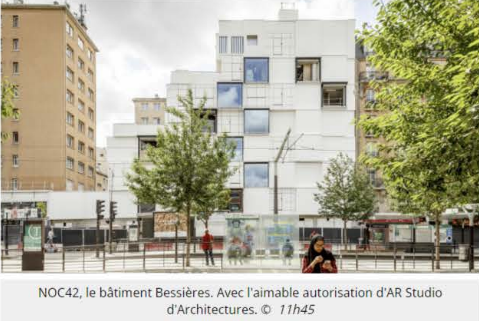
NOC42, le bâtiment Bessières. Avec l'aimable autorisation d'AR Studio d'Architectures.