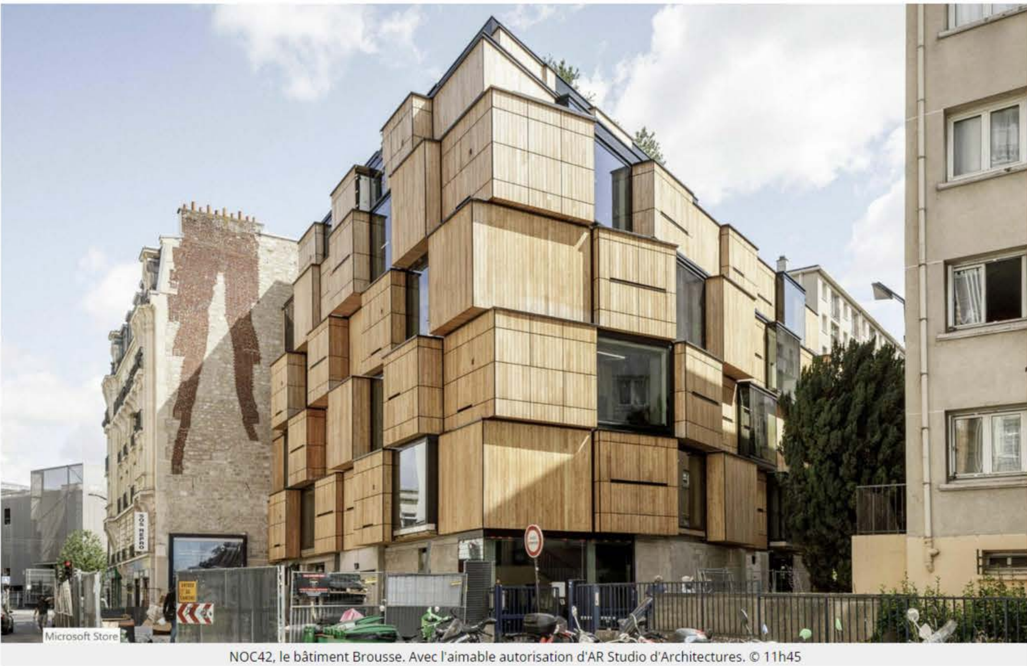
NOC42, le bâtiment Brousse. Avec l'aimable autorisation d'AR Studio d'Architectures. © 11h45