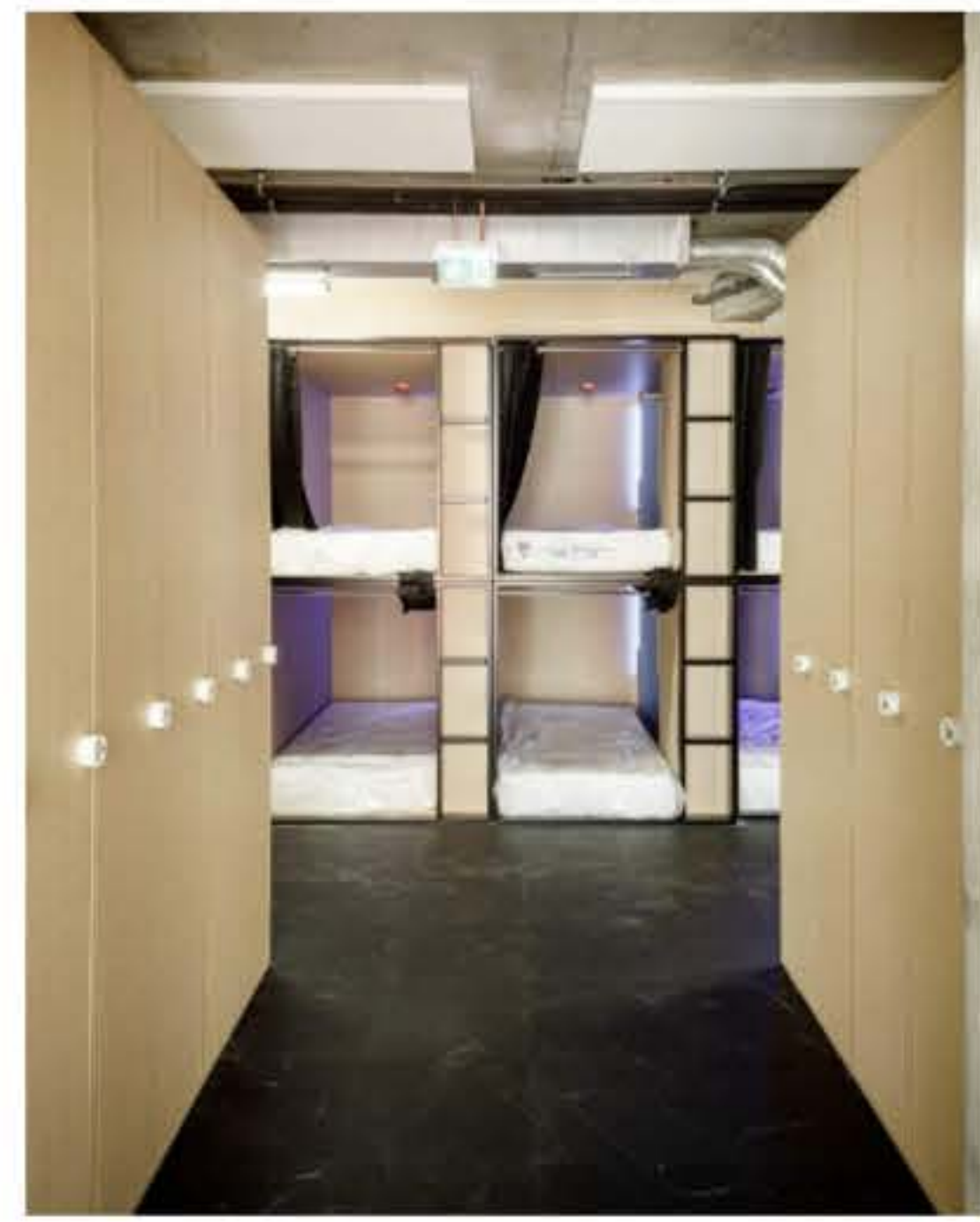
Couchage de style japonais au NOC46.