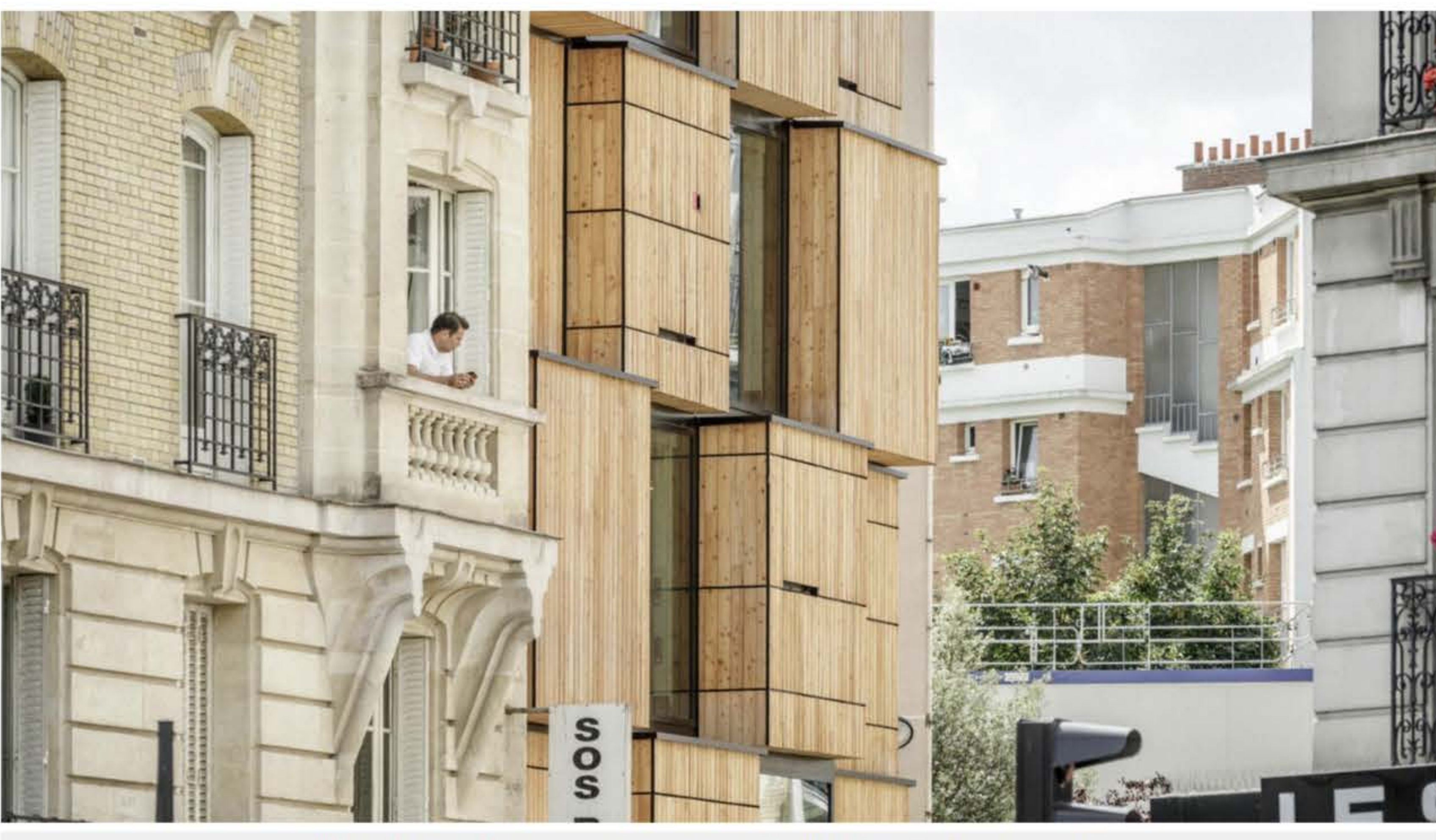
NOC42, le bâtiment Brousse. Avec l'aimable autorisation d'AR Studio d'Architectures.