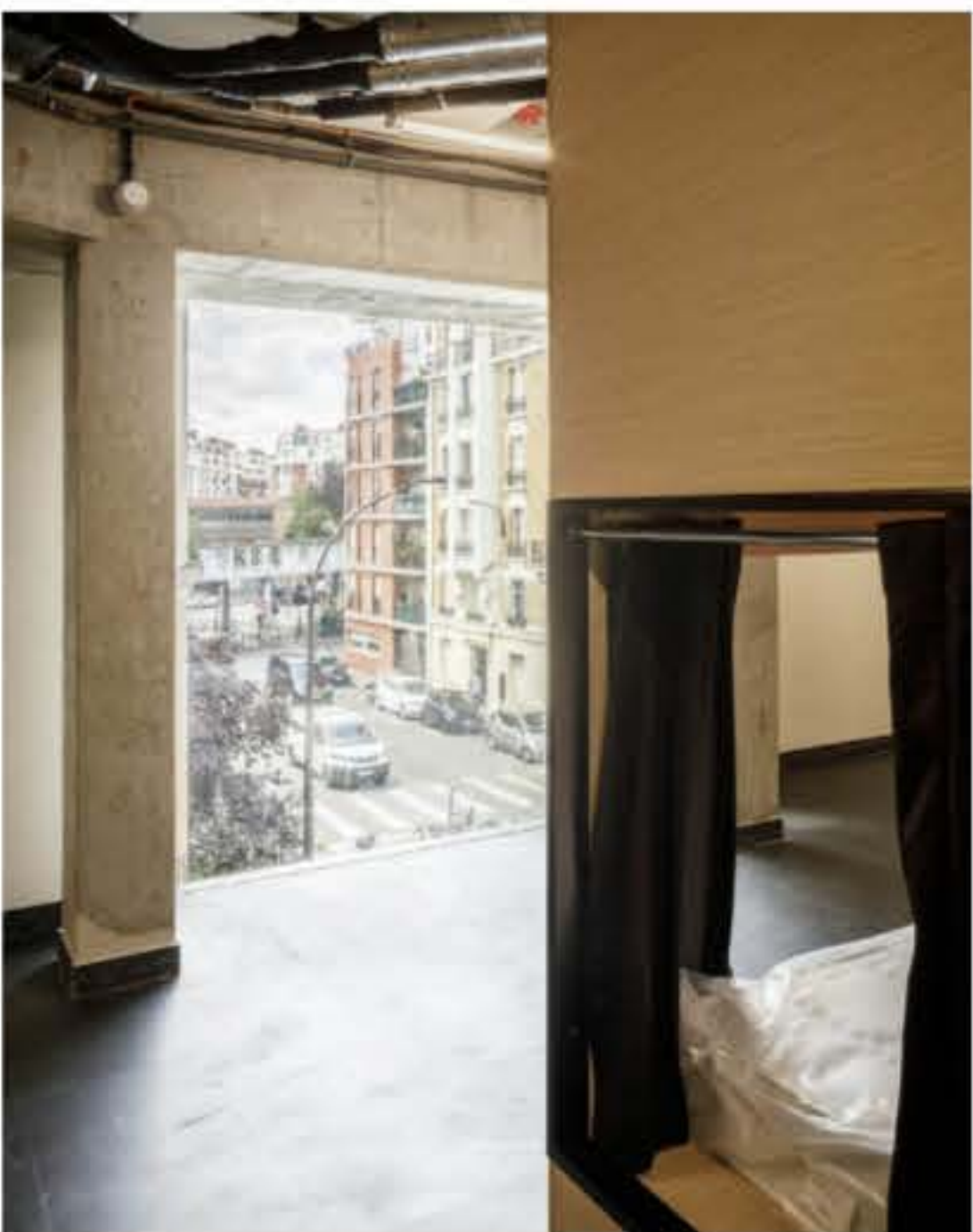
Couchage de style japonais au NOC46. Avec l'aimable autorisation d'AR Studio d'Architectures. © 11h45

Le bâtiment en bois Brousse porte la mission sociale du NOC42 en proposant des logements à des prix très bas. Leur résidence étudiante de 1 000 logements propose des lits cabines élégants et confortables qui, comme l'explique Raoul, ont permis « d'augmenter l'utilisation de l'espace disponible en utilisant le modèle de lit capsule utilisé dans certains hôtels au Japon ». Le bâtiment propose également des douches dans un espace dédié plutôt que de les disperser dans chaque zone de couchage, ce qui permet d'économiser de l'énergie primaire.